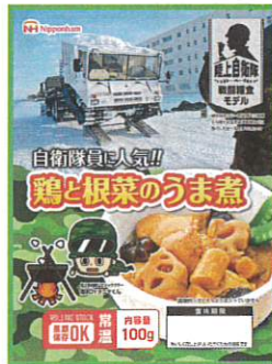
鶏と根菜のうま煮