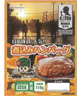
煮込みハンバーグ