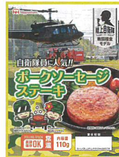
ポークソーセージ ステーキ