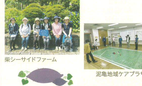
柴シーサイドファーム