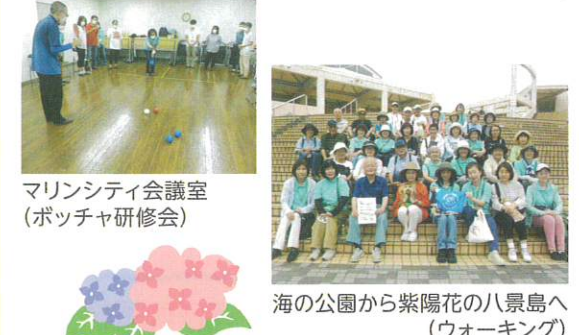
マリンシティ会議室 (ポッチャ研修会)