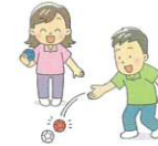
能見台地域ケアプラザ

能見台地域ケアプラザと共催で、毎月第2日曜日に「ポッチャ」、9月には「ディスコダンス」を行いました。