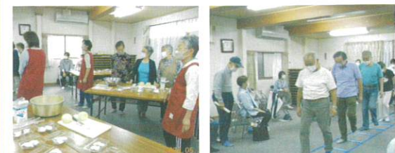
瀬ヶ崎西部町内会館 (ゴキブリ団子作り、コグニサイズ)

掲載写真の他に、6月に八景島ウォーキング、11月に健康チェックと、地域の皆様と楽しく多くの健康づくり活動ができました。