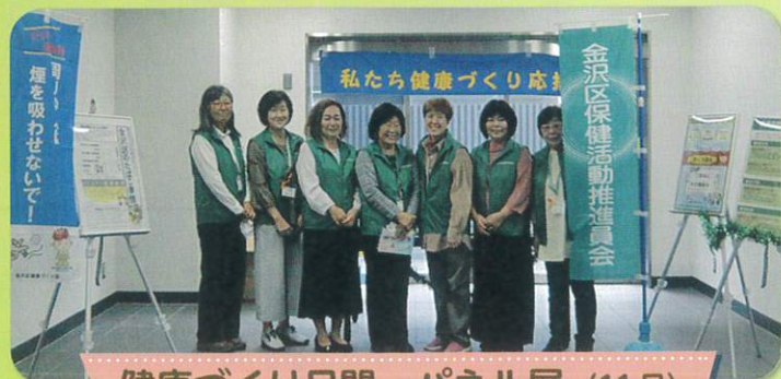
健康づくり月間 パネル展（11月）