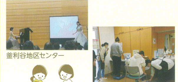
釜利谷地区センター