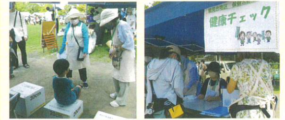
能見台中央公園グラウンド

4年ぶりに能見台地区フェスタに保活が参加。握力測定、棒反応、ロコモチェックの健康チェックを行いました。