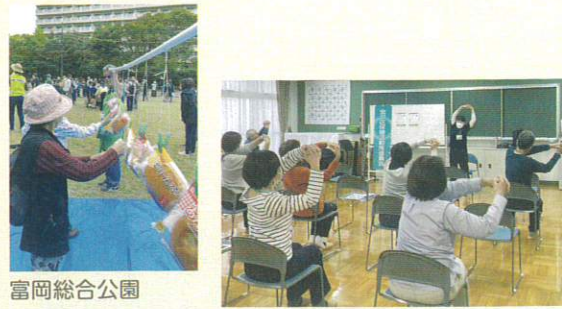
富岡総合公園 小田コミュニティハウス

10月のウォーキングイベントではパン取り競争を担当し、12月にはストレッチ・筋トレ講座を開催しました。