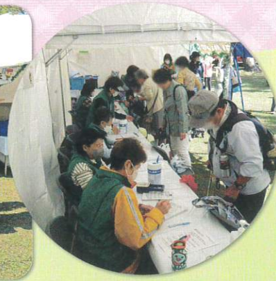
金沢まつり いきいきフェスタ（10月）

保健活動推進員ブースは今年も大盛況！ 海の公園で握力測定・活動紹介パネル展示を実施しました。当日は850の方にご来場いただき、年代問わず、みなさま楽しみながら測定されていました。