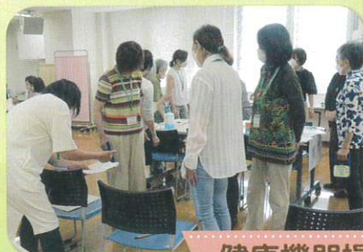
健康機器操作研修（6月）

今後の地区活動に役立てるため、BCチェッカー（血管年齢測定）・握力計・健口くんの操作方法を学びました。