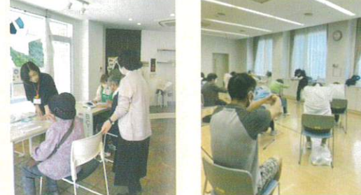
富岡薬局前 おかまちリビング