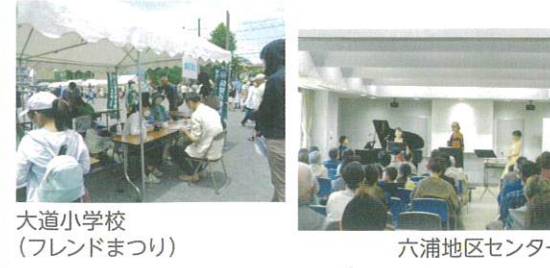
大道小学校 (フレンドまつり)