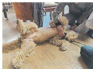
お腹も出しちゃう