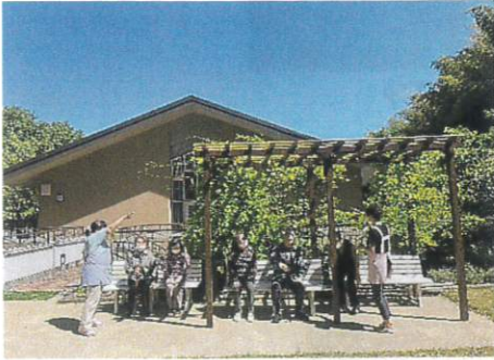
のんびりひとやすみ・・・

一人で外出するのは心配・・・という方も安心！広～い敷地内をのんびり歩いて心身ともにリフレッシュ！！元気ハツラツです。これからの時期は特に気持ち良いですよ～。広場まで約150mです。ほど良い疲れがよい感じ～