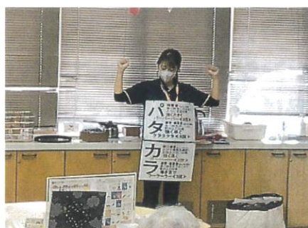
パタカラ体操でおくちも元気に！