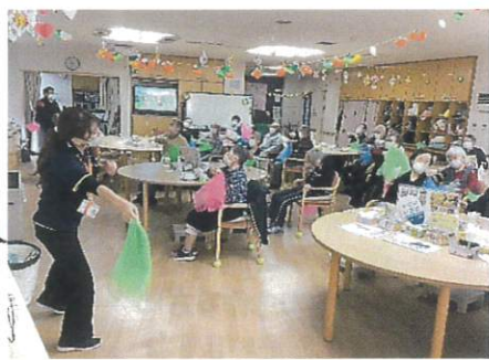
曲に合わせて布を振っています