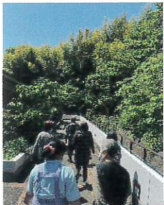
お日さまポカポカ屋外散歩

デイサービスでは一人ひとりに合わせた個別機能訓練を実施、無理なく体を動かせるプログラムをご用意しています。またみんなで行う体操や、150mのお散歩コースもあります。お散歩で太陽を浴びることで骨も丈夫になり、骨折予防にもなりますよ。