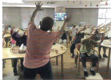
体操の先生が月4回来てくれます