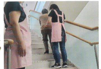
階段トレーニング