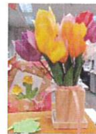
春のお花 By Y.Y

3月、春は選抜(甲子園)からという言葉が聞かれたことがあると思います。 甲子園大会も始まり暖かな日差しを感じる日々が増えてきたと思う今日この頃。 桜の花もカワヅザクラは既に満開。ソメイヨシノが少しずつ開花しているのではないのでしょうか。 4月の入学式には咲いて欲しいのですが。 ケアプラザの桜は…… まもなく満開となる予定です。