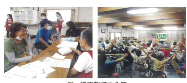
瀬ヶ崎西部町内会館 (健康チェック、コグニサイズ)

掲載写真の他に、5月に「ゴキブリ団子作り」、11月に「ヴェルニー公園散策」の実施ができ、R7年2月に「医療講演会」を実施しました。