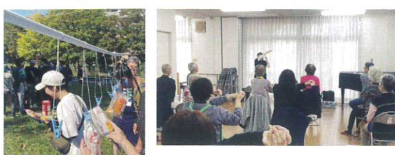
富岡ふれあいハウス