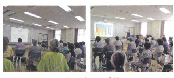
いきいきセンター金沢

今年度はいきいきセンターにて認知症予防健康講座「歌って楽しく音楽で健康に!」を開催出来ました。