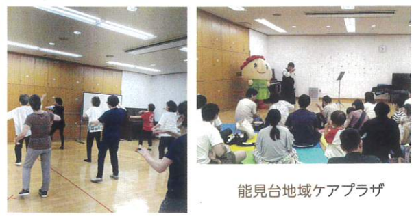
能見台地域ケアプラザ

ケアプラザと共催で、月イチ「ポッチャ」6月「ディスコダンス」9月「親子コンサート」を行いました。