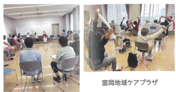
富岡地域ケアプラザ

定例の「育児教室」と「健康たちより処」に加え、「脳のリフレッシュ」と「ストレッチ」の講座を行いました。