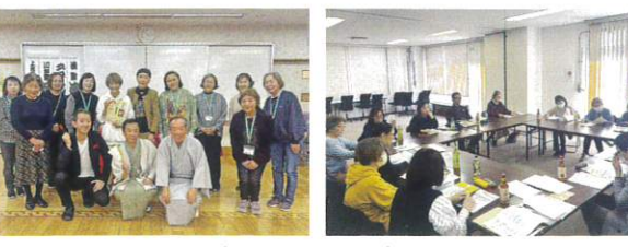
いきいきセンター金沢