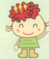
金沢区幸せお届け大使 ほたんちゃん