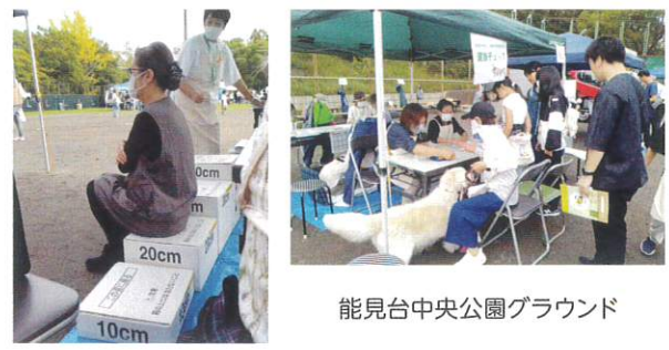
能見台中央公園グラウンド

能見台地区連合町内会主催の地区フェスタに保活ブースを出し、健康チェックを4種類実施しました。