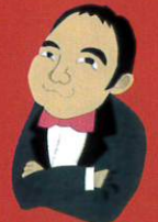
木村 裕 作曲