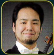
三又治彦 ヴァイオリン