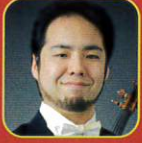
三又治彦 ヴァイオリン