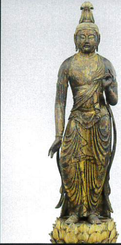
観音・勢至菩薩立像 清水寺(京都) 重要文化財 京都における鎌倉時代初期の運慶工房作とみられる