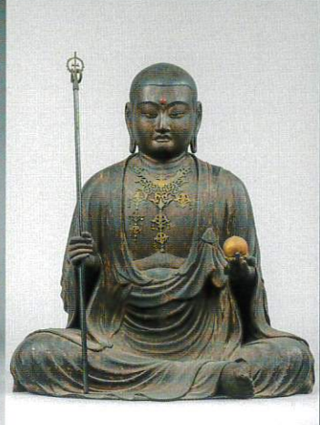
地藏菩薩坐像 康慶作 瑞林寺(静岡) 重要文化財 運慶の父が治承元年(1177)東国武士のために造像