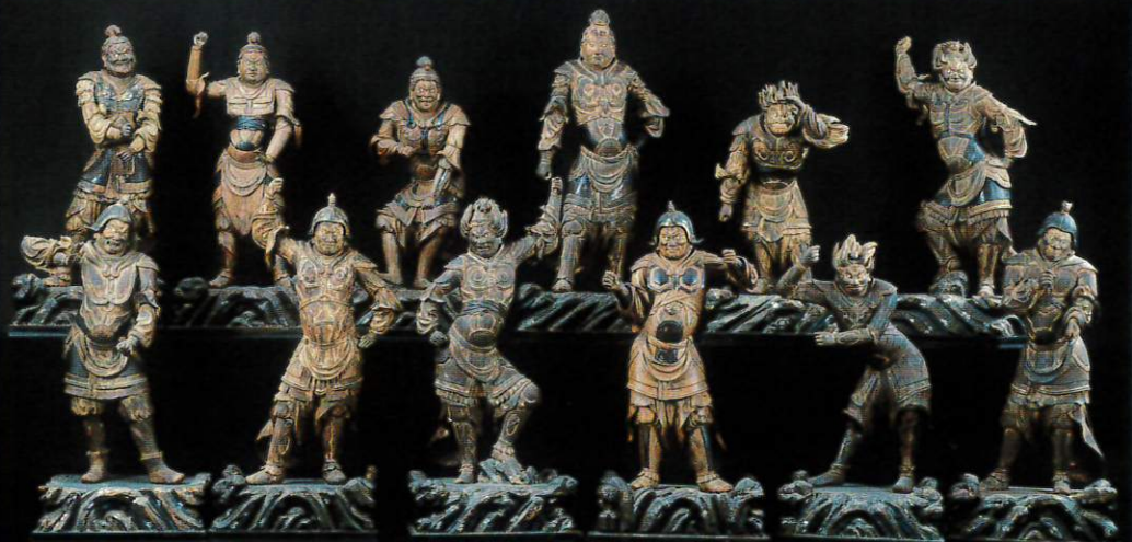
十二神将立像 曹源寺(神奈川) 重要文化財 運慶工房作の十二神将立像を一挙公開