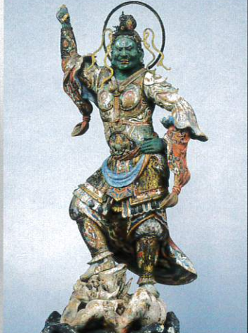
四天王立像(持国天) 海住山寺(京都) 重要文化財 解説上人貞慶ゆかりの四天王像で運慶工房作とみられる