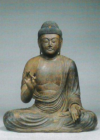
阿彌陀如来坐像 願生寺(静岡) 運慶作浄楽寺阿彌陀如来坐像に酷似する注目作