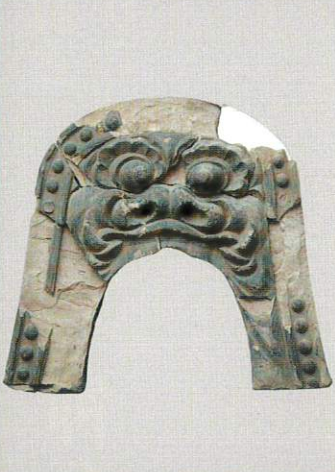
鬼瓦 鎌倉市教育員会 鎌倉永福寺出土で原型は運慶工房作とみられる