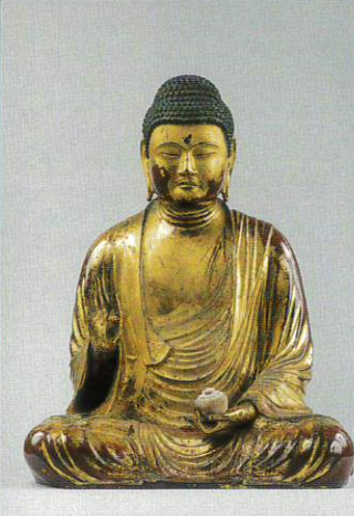
葉師如来坐像 寿福寺(神奈川) 重要文化財 北条政子発願で原型は運慶工房作とみられる