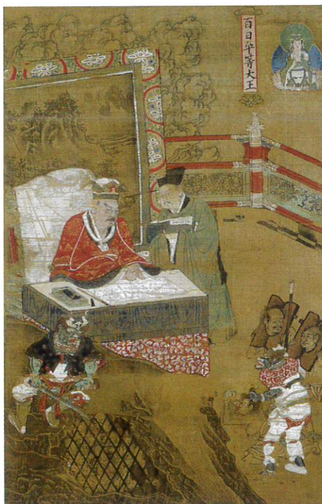
十王図のうち百日平等大王「陸信忠筆」落款元時代