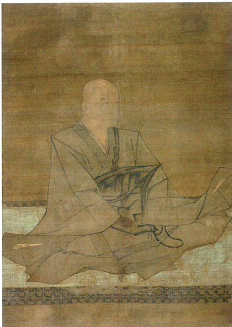
国宝 北条実時像 鎌倉時代

各最寄り駅から、当館への地図は本紙表面の2次元コードからホームページをご確認ください。