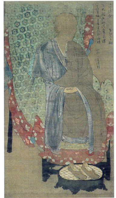
重文 審海像 鎌倉時代