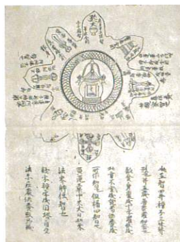
国宝 五藏曼荼羅和会釈巻下 鎌倉時代